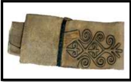
شكل رقم ( 9 ) حزام عربية حربية منفذ

تُستخدم في تنفيذ هذه التقنية مجموعة من الأدوات غير الحادة تُسمى "الدفره"، والتي