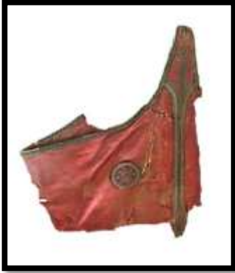
شكل رقم ( 12 )

هي من التقنيات التراثية المستخدمة منذ القدم وهي احداث تغير في سطح الخامة وتنفذ على خامات متنوعة ومنها الجلود الطبيعية والعظم ، والصوف الطبيعي والكتان ، حيث أفادت منال سيد أحمد (2012) أن الصبغة عبارة عن " مادة ملونة تستخدم مذابة لتلوين الاجسام المختلفة ، وهي تختلف عن المسحوق الملون الذي يضاف إلى