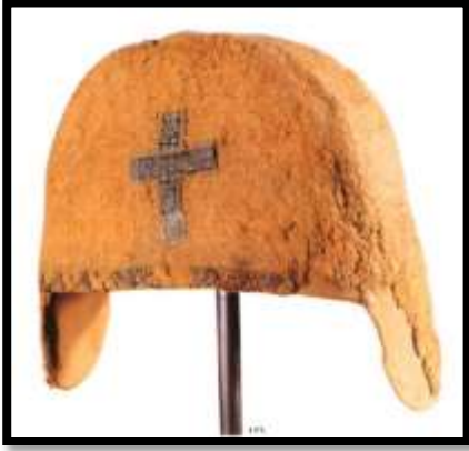
شكل رقم ( 13 ) غطاء للرأس يعود إلى العصر القبطى

التي تتماسك بعضها مع البعض عن طريق التسخين والترطيب ثم الإحتكاك الميكانيكى" ( 1 ) ويتضح من خلال شكل رقم ( 13 ) هو عبارة عن غطاء للرأس منفذ بتقنية التلييد ويعود إلى العصر القبطى وتتعدد أساليب التلييد فمنها التلييد بالطى ، والتلييد بواسطة الضغط الحرارة والرطوبة ، والتلييد بالإبرة