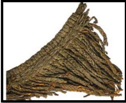
شكل رقم (4) مشغولة فنية من تقنية التصفير عثر عليها في قصر إبريم

" كما استفاد الفنان القبطي من تلك التقنية ، واستطاع استخدام هذه الطريقة بأربعة شرائط من الجلد فأعطت شكل حبال مجدولة ذات أربع أسطح ، واستخدمها الفنان القبطي في عمل الصلبان" (2) .