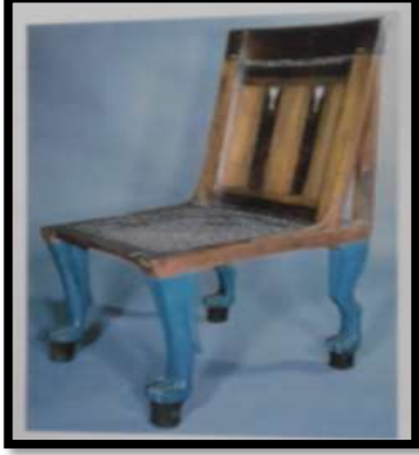
شكل رقم ( 8 )

خلفيات من خامات اخرى ملونة تظهر جمال الزخارف المفرغة ، وتتناسب هذه التقنية مع الجلود الطبيعية القوية المتماسكة ونفذت هذه التقنية مقعد فرعونى قاعدته منفذة بأسلوب التفريغ عن طريق تشابك السيور الجلدية متحف اللوفر ، كما فى شكل رقم ( 8 )