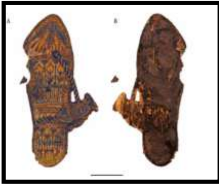
شكل رقم (5) حذاء الملك توت عنخ آمون المطرز على الجلد بالخرز الملون.

من أجمل التقنيات المستخدمة في زخرفة الجلود خاصة الأنواع الخفيفة والرقيفة ، وهي تعني " زخرفة الاسطح بواسطة إبرة او ما يقوم مقامها وباستعمال خيوط ملونة ، وتسمى الجزء أو الوحدة منها بالغرزة " (1)