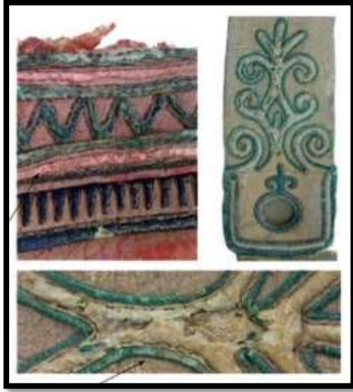
شكل رقم ( 2 ) تقنية الأبليلك فى أجزاء من عربة حربية

من أروع القطع الفنية التى تم تنفيذها بطريقة النسيج المضاف ( الأبليلك ) فى الحضارة المصرية القديمة " المظلة الجنائزية الخاصة بالملكة إيز محب والتى تعود إلى الأسرة الحادية والعشرون، وعثر عليها فى منطقة الدير البحرى والمحفوظة بالمتحف المصرى مصنوعة من جلد الغزال والتى إعتمدت زخرفة المظلة على طريقة تثبيت قطع جلدية على أرضية أخرى من الجلد والمظلة عبارة عن