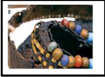
شكل رقم ( 7 ) مقطع من حذاء الملك توت عنخ آمون

شكل شقوق صغيرة في أسطح الجلد بمقاس يتناسب مع الشرائط المستخدمة في التدكيك (1)، تذكر ( سناء ) "وغالبا ما تكون الشقوق وحدات هندسية أو