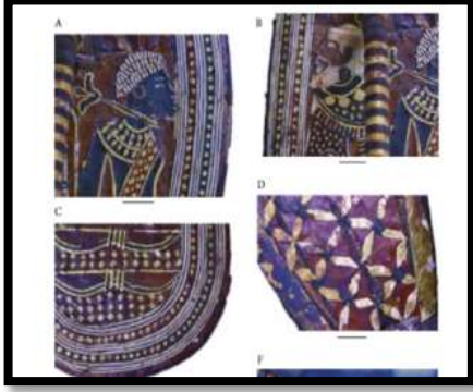
شكل رقم ( 6 ) مقطع من حذاء الملك توت عنخ آمون المطرز بالذهب .

و تصلح كل غرز التطريز لتنفيذها على أسطح الجلود الطبيعية ومنها " غرزة السراجة، الفرع بأنواعه، البطانية، السلسلة بأنواعها، رجل الغراب وغيرها من الغرز ، ويمكن تنفيذ التطريز بخامات متنوعة ،