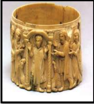
شكل رقم ( 10 ) صندوق من العاج منفذ بتقنية الحفر

التشكيلية التراثية المستخدمة في المصري القديم والقبطى والاسلامي" ( 1 ) استخدم المصري القديم تقنية الحفر في العديد من المشغولات ومنها الصناديق والأمشاط ومن الأمثلة على التي تبين دقة الفنان في استخدام تقنية الحفر صندوق من العاج يعود إلى الحضارة القبطية محفور عليه مجموعة الكهنة والقسيسين كما في شكل رقم ( 10 )