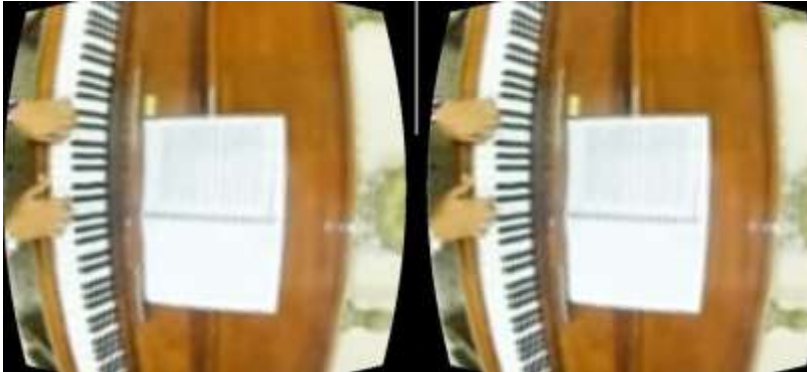
شكل رقم (5) يوضح قبل إرتداء نظارة الواقع الافتراضي (VR)