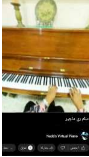
شكل رقم (8) يوضح أداء سلم رى الكبير من قبل الباحثة