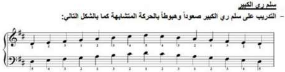
شكل رقم (7) يوضح سلم ري المدون من قبل الباحثة