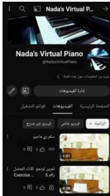
شكل رقم (2) يوضح محتوى قناة اليوتيوب الخاصة بالباحثة لتعليم آلة البيانو