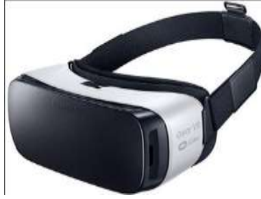
شكل رقم (3) يوضح نظارة الواقع الافتراضي (VR)

- وقد قامت الباحثة بمساعدة كل طالب تلو الآخر ليرتدي النظارة، وتقوم بتوجيهه حتى يرتديها بطريقة صحيحة ويقوم بتشغيل الفيديو المراد تشغيله.