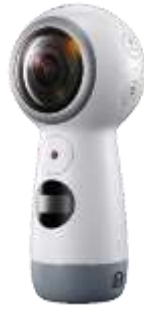
شكل رقم (1) كاميرا Samsung Gear 360