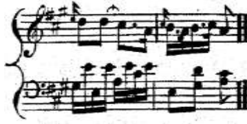
شكل رقم (14) يوضح حلية الأتشكاتورا المفردة في تنويجات البيانو عند جون فيلد.