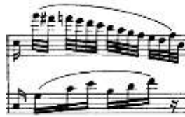
شكل رقم (29) يوضح الصعوبة الأدائية لصياغة للنغمات السلمية الهابطة للتنوع الثاني لجون فيلد

اداء تتابع نغمات منفرطة سلمية متسلسلة صعودا مقسمة على اليدين وجاء ذلك فى المدونة الموسيقية على النحو التالى :