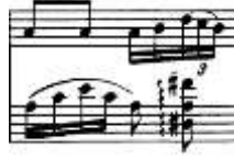
شكل رقم (25) يوضح الصعوبة الأدائية لحلية الأريجيرو للتتويح الثاني لجون فيلد

متطلبات الاداء: ويتطلب اتقان ادائها التعرف مفهوم اصطلاح حلية الاريجيرو وهي كلمة انجليزية وايطالية تعنى اداء نغمات التالف بالتعاقب الواحدة تلو الاخرى صعودا وهبوطا بدلا من ادائها هارمونيا فى نفس الوقت.