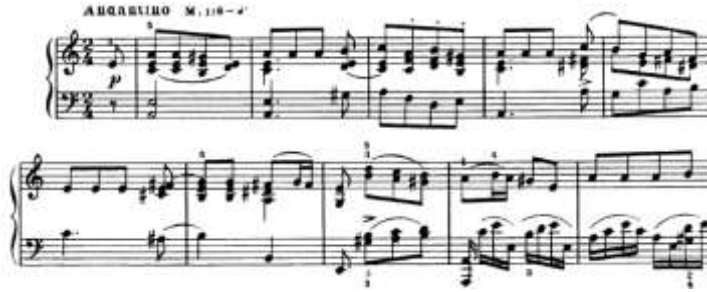
شكل رقم (15) يوضح تنويع البيانو الأغنية الشعبية الروسية لجون فيلد

النسيج: هوموفونى -بوليفونى الطول البنائى: 152 مازورة