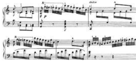
شكل رقم (19) يوضح من م (45) إلى م(75) للتتويح الثاني لجون فيلد

من م56 الى م75: ظهرت الصياغة اللحنية متعددة الاسطر اللحنية باستخدام النغمات المزدوجة والمنفردة الصاعدة والهابطة في اليد اليمنى اما اليد اليسرى ظهرت ففيها النغمات المزدوجة والاوكتافات والتالفات الثلاثية والرابعة والنغمات المتكررة ، والشكل التالي يوضح ذلك: