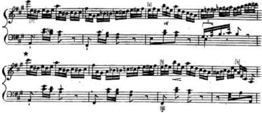
شكل رقم (5) يوضح من م33: م40 لتتويجات البيانو لجون فيلد.

ويمكن تقسيمها الى الافكار الاتية من م33 الى م40 : وهى عبارة عن جملة موسيقية منتظمة عبرت فيها الصياغة اللحنية عن ثلاثة اسطر لحنية اليد اليمنى عبارة عن نغمات منفردة يتخللها النغمات الكروماتيكية اما اليد اليسرى فهى عبارة عن نغمات مزدوجة او نغمات منفردة به نغمات منفردة ونغمات ممتدة، والشكل التالى يوضح ذلك: