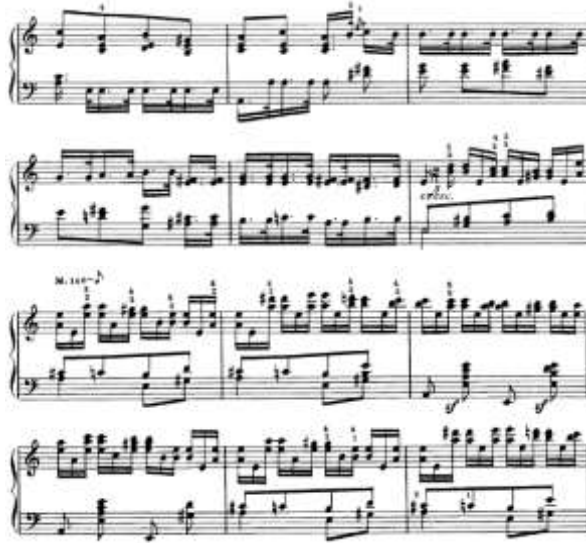
شكل رقم (17) يوضح من م (27) إلى م (44) للتتويج الثاني لجون فيلد

من م 27 الى م 44: عبارة عن تالقات ثلاثية هارمونية ونغمات متكررة ونغمات مزدوجة وظهرت حلقة التشكاتورا المفردة والقفزات اللحنية على بعد رابعة وخامسه اما فى اليد اليسرى ظهرت فيها النغمات المزدوجة والمتكررة ايضا والتالقات الرباعية، والشكل التالي يوضح ذلك: