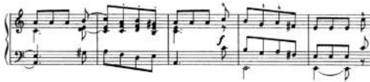
الشكل رقم (24) يوضح من م(138) الي م (142) للتنوع الثاني لجون فيلد

من م138 الى م152: اعادة للجزء الاول a وانتهت بقفلة تامة في سلم لا الصغير، والشكل التالي يوضح ذلك: