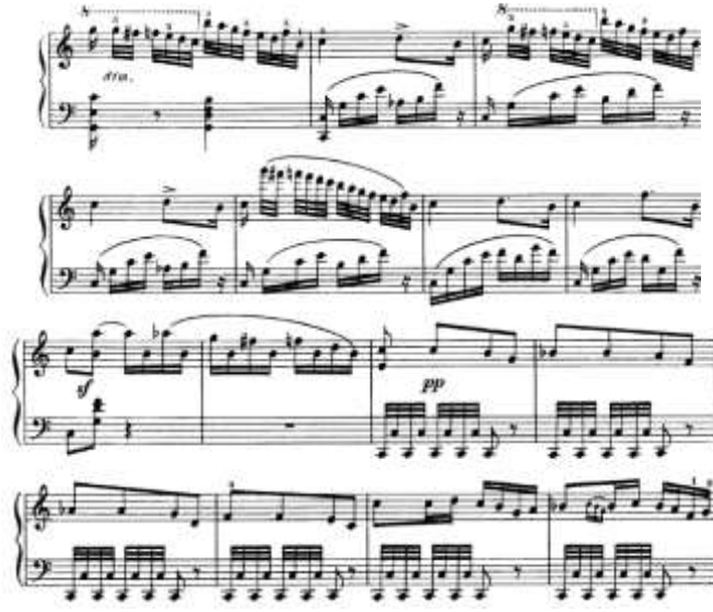
شكل رقم (22) يوضح من م(107) إلى م(127) للتنوع الثاني لجون فيلد

من م128 الى م152: تدوينه في سلم مي الكبير وهو تصوير للجزء من م128 الى م137 وهو تصوير للجزء من م95 الى م100 على بعد رابعة تامة هابطة.