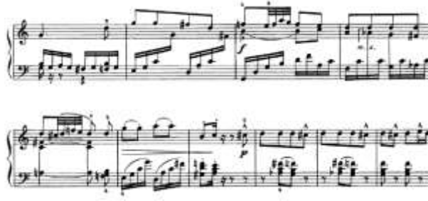
شكل رقم (20) يوضح من م(76) إلى م(95) للتوزيع الثاني لجون فيلد

من م 96 الى م 106: عبرت الصياغة اللحنية عن نغمات هابطة منفردة سلمية صاعدة وهابطة باستخدام الاسلوب الكروماتيكي او تارجح نغمة منفردة مع اوكتاف اما اليد اليسرى ظهرت ظهرت فيها التالقات الثلاثية والرباعية العنقودية والمتسعة، والشكل التالي يوضح ذلك: