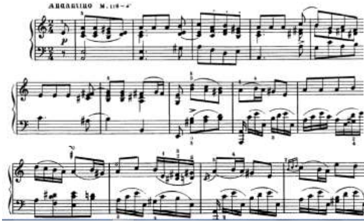
شكل رقم (16) يوضح التدوين الموسيقي من أنا كروز (1) إلي م (26) لتتويجات البيانو لجون فيلد.

من م 27 الى م 44: عبارة عن تالقات ثلاثية هارمونية ونغمات متكررة ونغمات مزدوجة وظهرت حلقة التشكاتورا المفردة والقفزات اللحنية على بعد رابعة وخامسه اما فى اليد اليسرى ظهرت فيها النغمات المزدوجة والمتكررة ايضا والتالقات الرباعية، والشكل التالي يوضح ذلك: