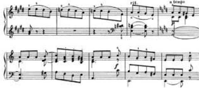
شكل رقم (23) يوضح من م(128) إلى م(138) للتنوع الثاني لجون فيلد

من م128 الى م152: تدوينه في سلم مي الكبير وهو تصوير للجزء من م128 الى م137 وهو تصوير للجزء من م95 الى م100 على بعد رابعة تامة هابطة.