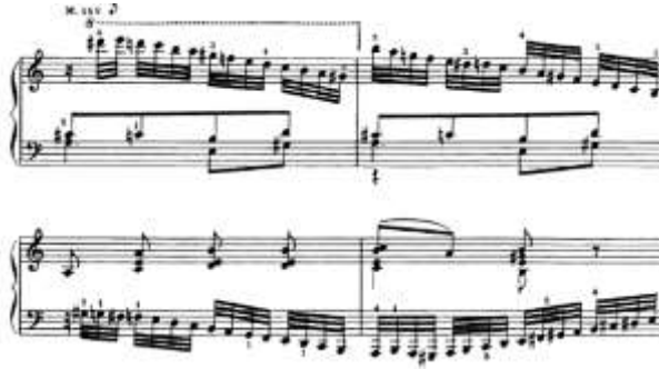
شكل رقم (18) يوضح من م(45) إلى م(55) للتتويح الثاني لجون فيلد

من م56 الى م75: ظهرت الصياغة اللحنية متعددة الاسطر اللحنية باستخدام النغمات المزدوجة والمنفردة الصاعدة والهابطة في اليد اليمنى اما اليد اليسرى ظهرت ففيها النغمات المزدوجة والاوكتافات والتالفات الثلاثية والرابعة والنغمات المتكررة ، والشكل التالي يوضح ذلك: