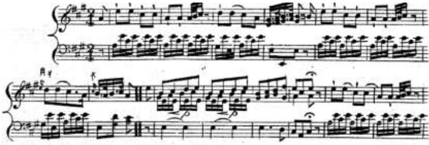
شكل رقم (1) يوضح تنويع Falalala البيانو لجون فيلد.