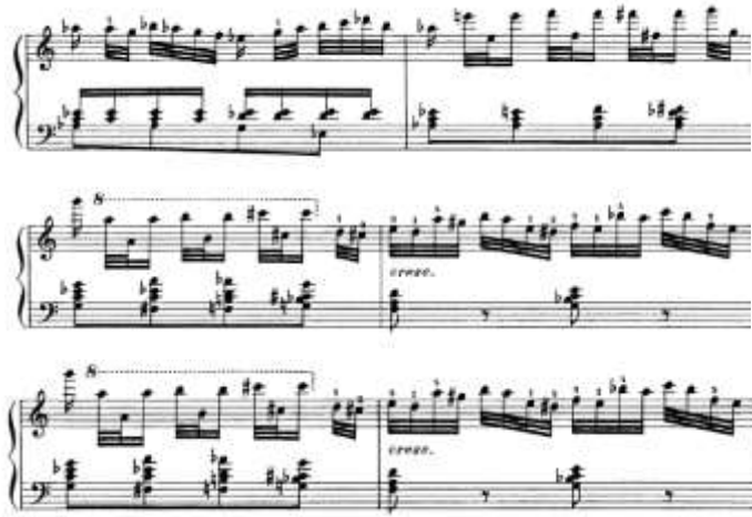
من شكل رقم (21) يوضح من م(96) إلى م(106) للتوزيع الثاني لجون فيلد

من م 96 الى م 106: عبرت الصياغة اللحنية عن نغمات هابطة منفردة سلمية صاعدة وهابطة باستخدام الاسلوب الكروماتيكي او تارجح نغمة منفردة مع اوكتاف اما اليد اليسرى ظهرت ظهرت فيها التالقات الثلاثية والرباعية العنقودية والمتسعة، والشكل التالي يوضح ذلك: