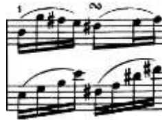
شكل رقم (26) يوضح الصعوبة الأدائية لحلية الجروبيتو للتتويح الثاني لجون فيلد

الصعوبة الثانية: الصعوبة الأدائية لحلية الجروبيتو م16 في اليد اليسري: