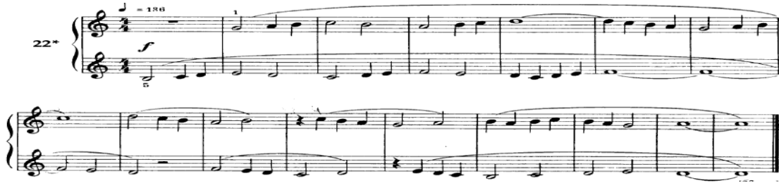
شكل رقم ( 3 ) يوضح التمرين رقم (22) من كتاب بيلا بارتوك