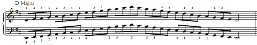
شكل رقم ( 2 ) يوضح سلم رى الكبير أوكتافين