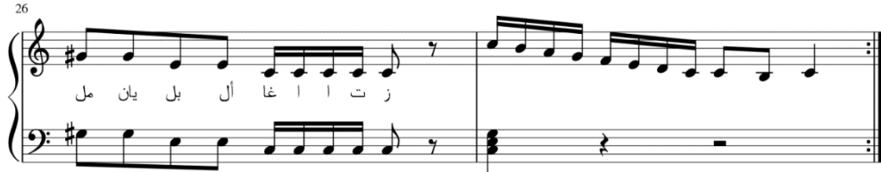
شكل رقم (1) أغنية التألفات الثلاثية