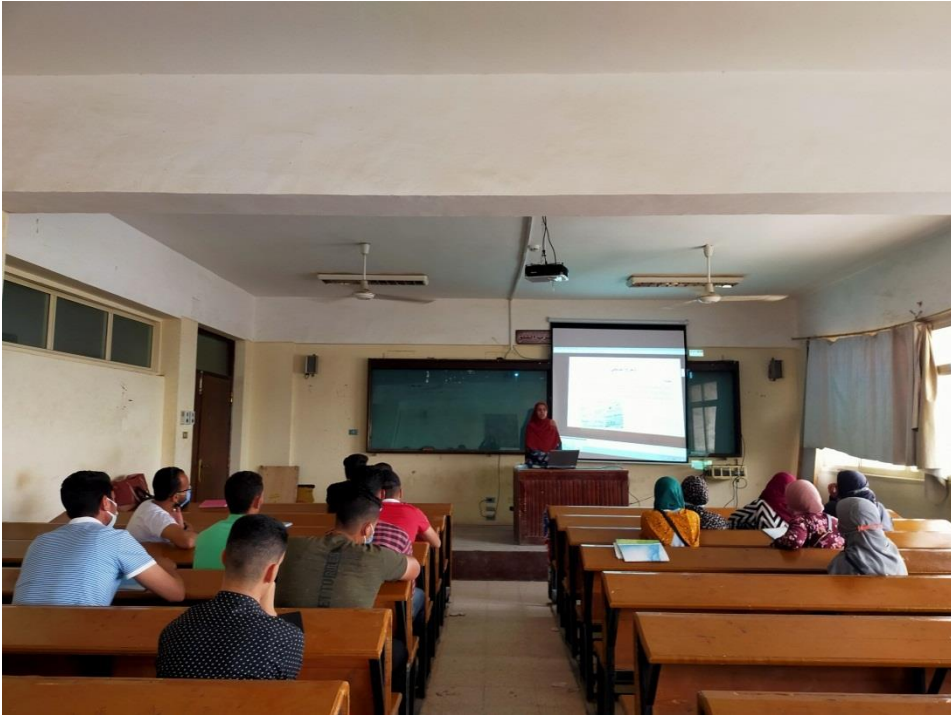
صور متفرقة من جلسات البرنامج التدريبي

9) التطبيق البعدي : بعد الانتهاء من تنفيذ جلسات البرنامج التدريبي كاملاً قامت الباحثة باختبار بعدي لمهارات التحرير الصحفي علي المجموعتين التجريبية والضابطة ؛ لمعرفة الأثر المباشر للبرنامج التدريبي والتأكد من فاعليته من خلال تفريغ البيانات وتحليلها إحصائياً .