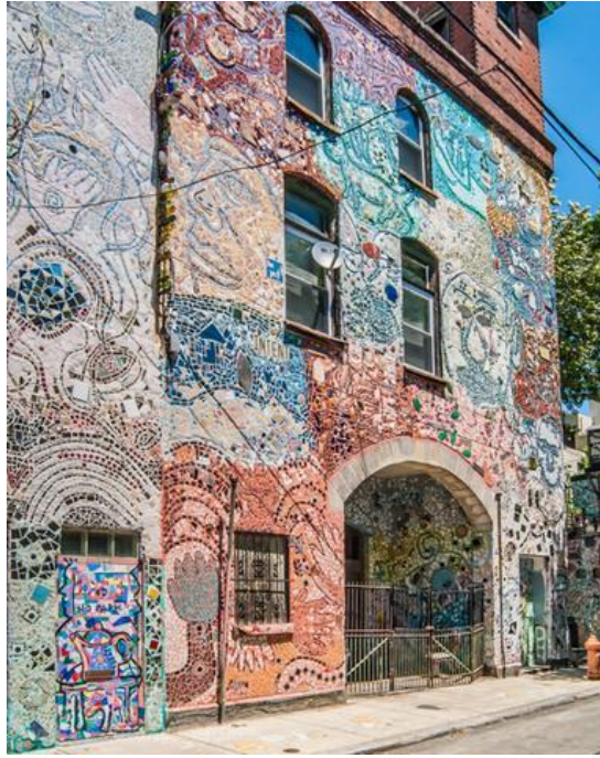
شكل رقم (1) للفنان أشعيا زاجا (Isaiah Zagar)

أحدى حوائط فيسيفساء منطقة الشارع الجنوبي في فيلادلفيا 2