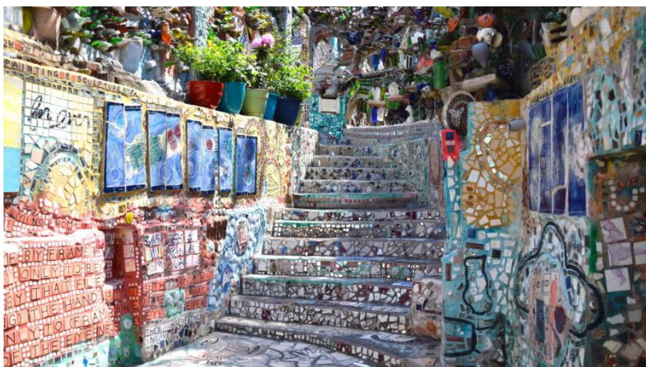
شكل رقم (5) إحدى السلالم الداخلية للحديقة 6