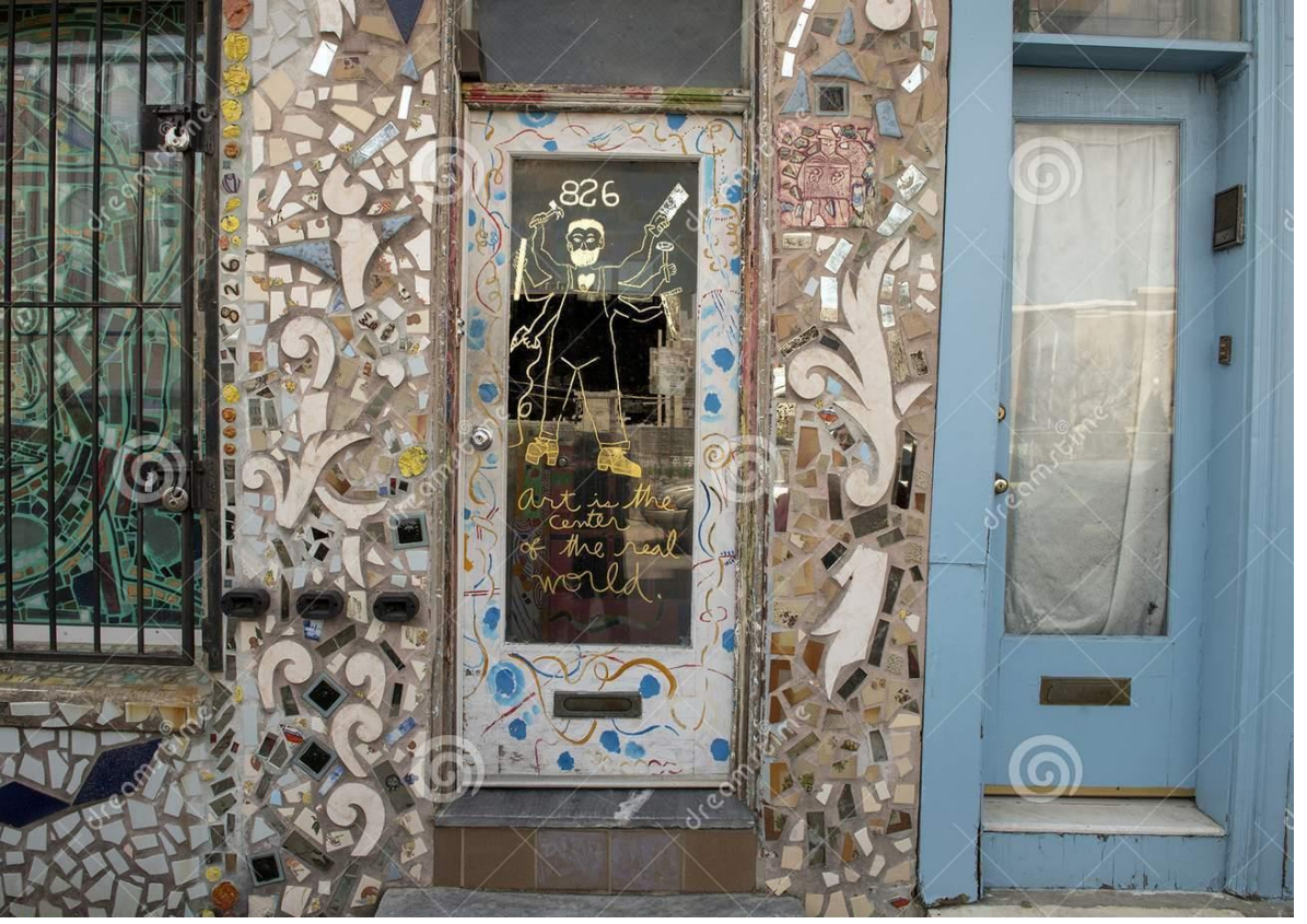
شكل رقم (2) مدخل منزل الفنان أشعيا زاجا (Isaiah Zagar) _ فيلاديفيا 3