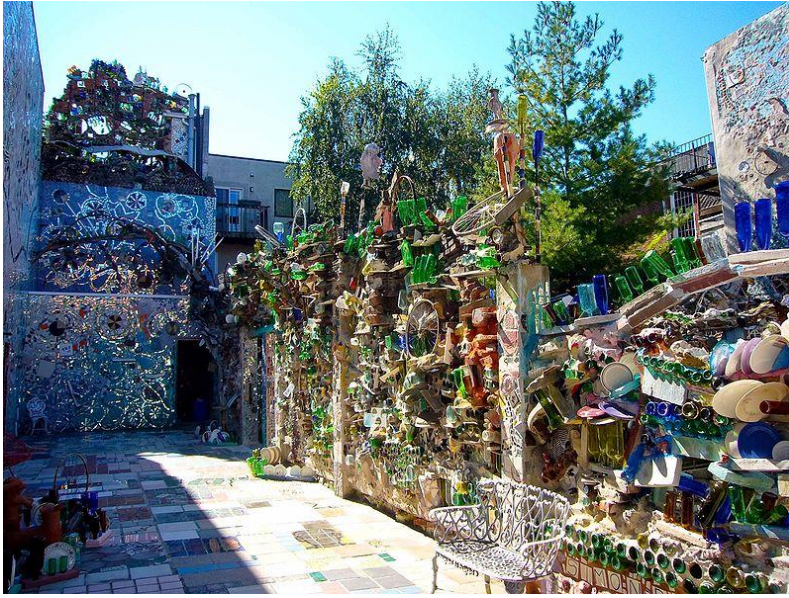
شكل رقم (3) الفنان أشعيا زغار (Isaiah Zaga) _ حديقة السحر _ Magic Garden