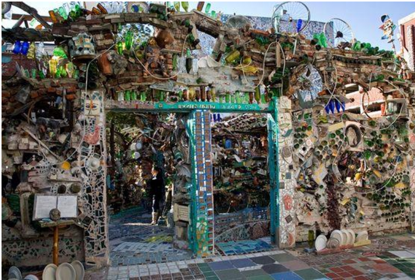
شكل رقم (4) أحدى الحوائط لحديقة السحر 5