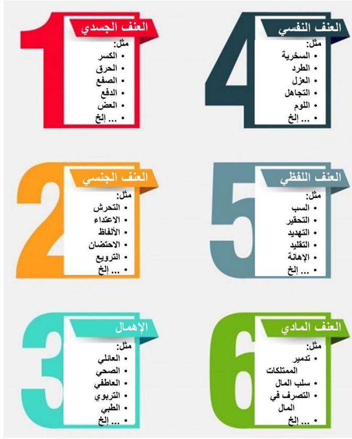
شكل (1): أشكال العنف الأسري الموجه ضد الأطفال . إعداد الباحثين .