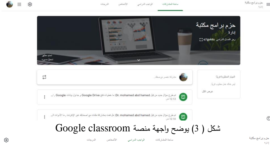
شكل (3) يوضح واجهة منصة Google classroom

ويقوم الطالب بالدخول إلى https://classroom.google.com/h ومن ثم يطلب الدخول إلى مجموعته وفق كود لكل مجموعة، وتم إتاحة الأهداف المصادر والمهمات لكلاً من المجموعتين في نفس الوقت ، ولكن تم إتاحة الأنشطة للمجموعة الثانية بعد الانتهاء من دراسة الموضوعات .