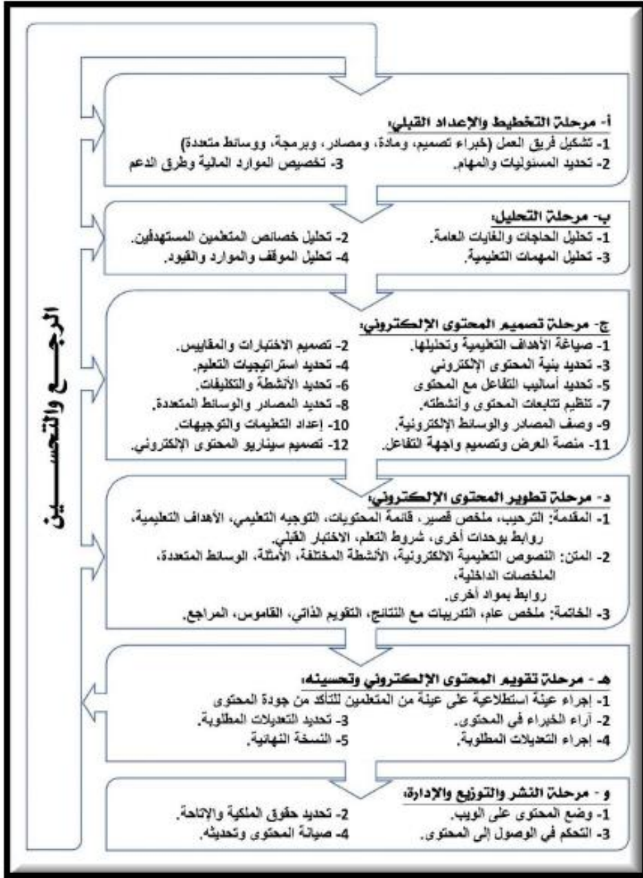
شكل (2) نموذج محمد عطية خميس (2015)

أ-مرحلة التحليل والإعداد القبلي: يتم في هذه المرحلة عدة إجراءات كما يلي