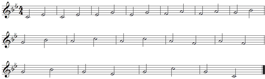
شكل رقم (2) التمرين الأول لمقام الراسـت