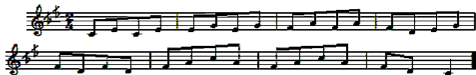
شكل رقم (3) التمرين الثاني لمقام الراسـت